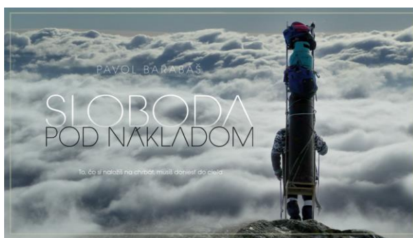
Film Sloboda pod nákladom

POŠTOVÁ ADRESA: Hory a mesto Fedáková 24 Bratislava 841 02