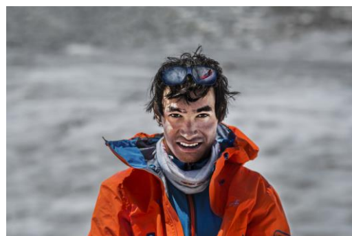
Film Lunag Ri