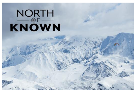
Film North of Known