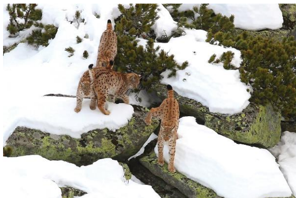
Život v oblakoch