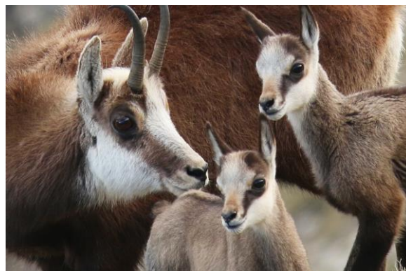
Život v oblakoch